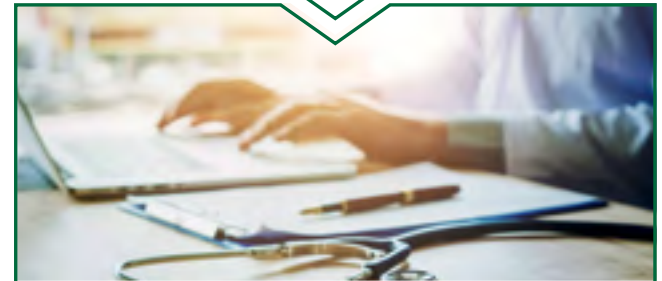
الطبيب يكتب تقرير النتائج ومذكرة رسوم، ويملاء الاستمارات ذات الصلة (G0612). (لتقديم طلب إلى شركة التأمين الصحي، يملأ الطبيب استمارة «مرسوم إعادة التأهيل الطبي»).