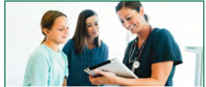
الطبيب يُوصي بإجراءات إعادة التأهيل وينصح الآباء وطفلهم.