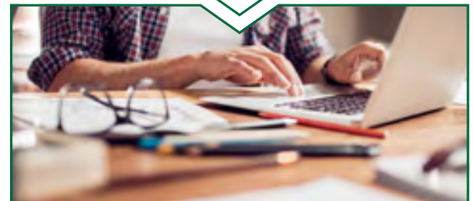
يملاء الوالدان استمارات الطلب (G0200) ويُقدّمونها مع تقرير النتائج ومذكرة الرسوم الخاصة بالطبيب (تُقدّم على سبيل المثال مراكز المشورة المتعلقة بالتأمين التقاعدي الألماني المساعدة في تقديم الطلب، لتحديد موعد من خلال الموقع الإلكتروني www.eservice-drv.de أو من خلال شركات التأمين الصحي).